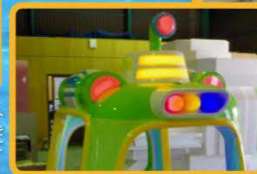
キッズライドを思わせるインパクト抜群のボディ。子供たちの興味を惹き、遊んでいるところを撮影しても絵になりにやすいのも利点だ

やマントなど見た目にも子供に人気の高い生き物を用意しています。他にも深海魚のような珍しい生き物も出たので、ランダムでレアな生き物が出る仕掛けも考えています。やはり、アーケードのマシンですので、毎回同じ内容では物足りません。通過するコースで登場する生き物も変化する予定ですが、何が登場するかわからないゾーンなども検討したいですね。 ——プレイの平均時間はどのくらいでしょうか？ 開発 3分〜3分半を想定しています。子供たちがプレイして満足してもらえ、ポリリウムを想定しています。 ——プレイ操作は操縦桿を左右に動かすだけでしょうか？ 開発 基本は操縦桿を左右に傾けて、操縦したりクイズの回答を選びます。ですが、せっかく操縦桿にボタンもあるので使いたいですね。現段階ではコースの最後はクイズがあります。コースの途中でもう一問出てきても面白いですが、知識を学ぶトリビアだけでなく、画面の中に魚が何匹いたか?などの問題があっても面白いです。知育要素を大切にしながらも遊びは忘れないようにしたいです。 ——知育要素があると、保護者も遊ばせたいと思うものでしょうか？ 開発 そういった効果も当然あると思います。ですが、「下キドキ海底らんど」を遊ぶことで、親子の会話を作ること大切にしたいと考えています。そのためには、まず子供の目線に立ち、子供たちに「遊びたい」と思ってもらえるのが大事です。知育とゲームのバランスをうまく取ることが重要で、知識を詰め込むのではなく情報・映像を重視するのも、そうした面への配慮です。子供たちもゲーム内で珍しいものに会おうと、周りに自慢したくなる。「知育を出しながらも、そういった楽しさで遊べるマシンです。」 ——プレイ時は一人乗りが基本でしょうか？ 開発 キッズライドと違って揺れまさんのので、親御さんと一緒に乗って欲しいです。運転は子供に任せ、親御さんは横でサポートする感じがベスト。そうすることで、会話のきっかけも生まれやすくなると思います。 ——筐体の前方・後方の窓部分が広く開いているので、そこから親御さんがサポートもできます。潜水艦をモチーフとした筐体デザインもLEDで映えやすく、写真を撮ってSNSやインスタにアップするのも最適な筐体です。 ——メンテナンスや筐体のサポート面はいかがでしょう？ 開発 ライトではないので、メンテナンスの苦労はほぼないと思います。安全面はプレイする子供たちが触る可能性がある箇所はもちろん、周囲を走り回ってぶつかった時の対策なども考慮し、万全を期しています。これは絶対ですので、ローカライズの初期段階から慎重に取り組んでいます。 ——サポートも本格的に必要になってくるのは部品が使い始めて2〜3年後になると思うのですが、最近海外製品の方が部品やソフト面を交換しやすいような製造工程・部品が採用されていることが多く、むしろ保証が行いやすくなるかもしれません。 ——来春の稼働予定ですが、レンタルプランも用意されているのですか？ 開発 はい。レンタルプランは機ミダスエンターテイメントさんが担当されますので、ぜひお問い合わせください。 ——実際のところ、まだまだ開発段階でこれから面白くなる部分をどこまで追加していくのか検討している最中ですが、年末にはロケテストを予定しておりますが、現段階から大きく進化したものを来年のJAEPOで御見せしますので、ぜひご期待ください。 レンタルプラン有 レンタルについては機ミダスエンターテイメントとご契約頂きます。詳細は別途ご案内いたします。