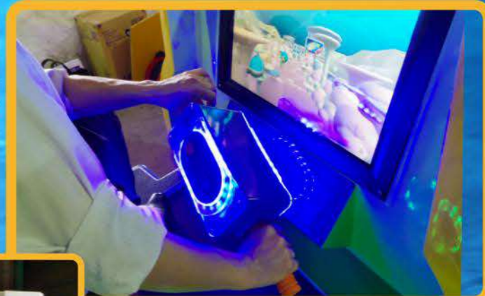
ゲームを進めて行くと、途中で左右の分岐ポイントが出現。操縦桿を傾けて進みたい方を選ぶと、「海の生き物」の映像が流れる仕組みとなっている

ゲーム操作は潜水艦の操縦桿を握って左右に傾けると、画面内の潜水艦が倒した方向に移動。コース中に左右のどちらに進むか選べるポイントが数カ所用意されており、選んだコースに登場する生き物の映像・解説が流れるようになっている。また、筐体の前方・後方の窓部分が開いているので、ここから子供たちが楽しく遊んでいる様子も撮影可能。鮮やかな電飾が光る筐体で、インスタやSNS映える点も魅力となる。