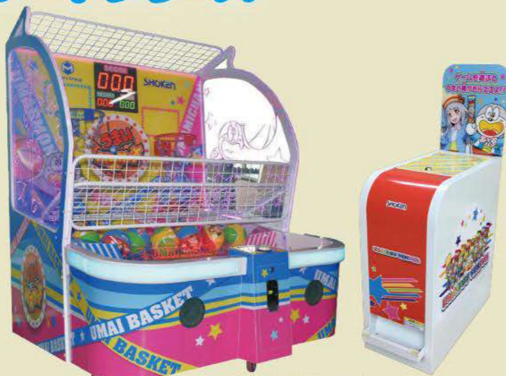
うまいバスケット & うまい棒ベンダー うまいバスケット:OP価格49万円(税別) / 発売中 うまい棒ベンダー:販売価格15万8000円(税別) / 発売中

HONDAの人気車種「N-BOX」のカスタムver.をキュートにデフォルメしたキッズライド。アニメーションドライブによる本格的な運転体験に加え、パワーウィンドウまで搭載する本格派。インスタ映えしやすいよう、見栄えの良さもこだわり抜かれている。