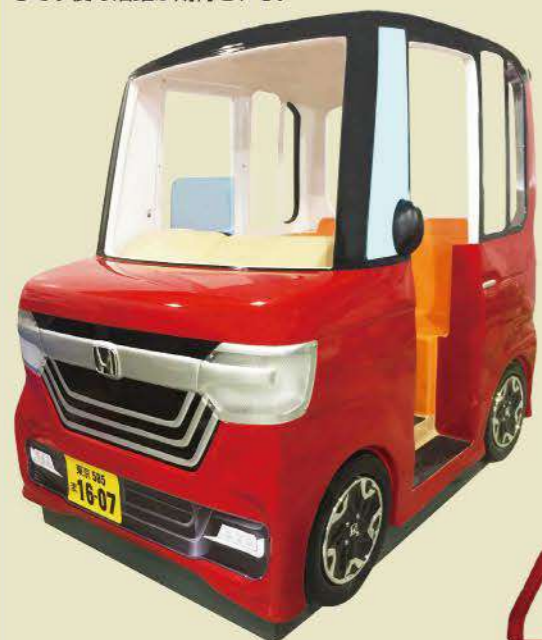
みんなでドライブ!! N-BOXカスタムver. OP価格104万円(税別) / 発売中

減少が続く国内のキッズマシン市場において、開発にも注力し、存在感が日増しに高まるマインズ。グループ会社の「ショーケン」が旧ホープ社のサービス・メンテナンスを承継し、新旧のキッズ機に強さを発揮。SCロケの大きな味方として今後の活躍が期待される。