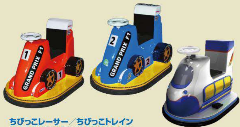
ちびっこレーサー / ちびっこトレイン ちびっこレーサー:OP価格29万8000円(税別) / 発売中 ちびっこトレイン:OP価格32万8000円(税別) / 発売中

ジープ型のライドに乗り込み、二人で協力しながらゴールを目指すキッズドライブゲーム。「大草原」「アイスワールド」「砂漠」の3コースから選択して冒険に突発。最後に待ち構えるボスを倒してゴールを目指す。