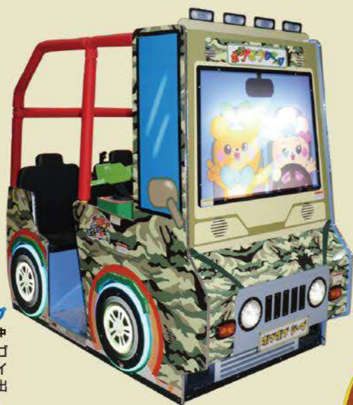
بوببوبزيب OP価格68万円(税別) / 発売中

姉やおさんのロングセラー商品「うまい棒」のキャラクターとコラボした子供向けバスケットゲーム。ゴールした得点を競うシンプルで、家族・友達で仲良く楽しめる。オプションでゲームをプレイすると「うまい棒ベンダー」も獲得できる「うまい棒ベンダー」も発売中。